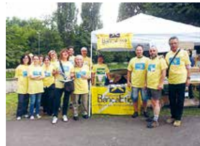
Un momento de la caza del tesoro