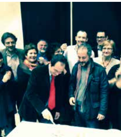
La festa del Git Lazio alla Pelanda di Roma