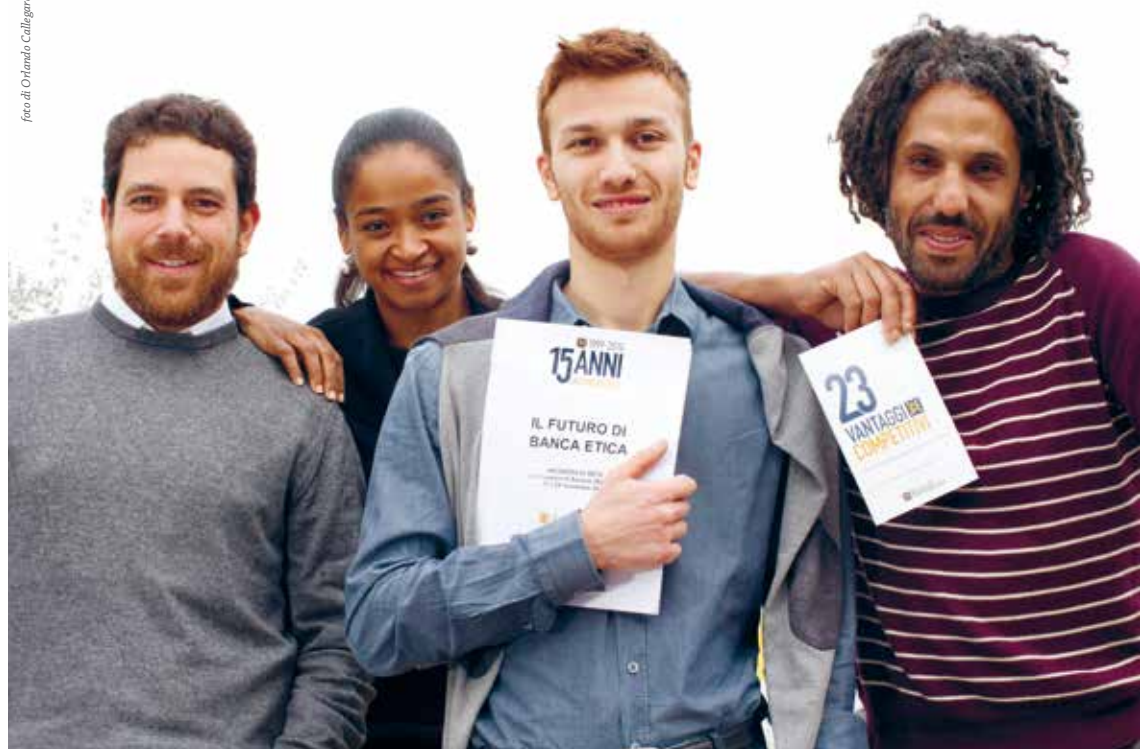
Personas socias y personal laboral de Banca Etica durante el fórum en red - Bolonia 2014