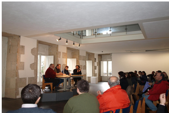
Esta imaxe pertence á constitución de Asociación Fiare Galiza o 16 de xaneiro de 2010 en Santiago de Compostela.

O Proxecto Fiare agrupa cada día a máis persoas e entidades en todas as súas asociacións territoriais. Manter unha relación próxima á sociedade que pretendemos transformar parécenos esencial e por iso animámosvos a que vos acheguedes á asociación FIARE máis próxima (Fiare Galiza).